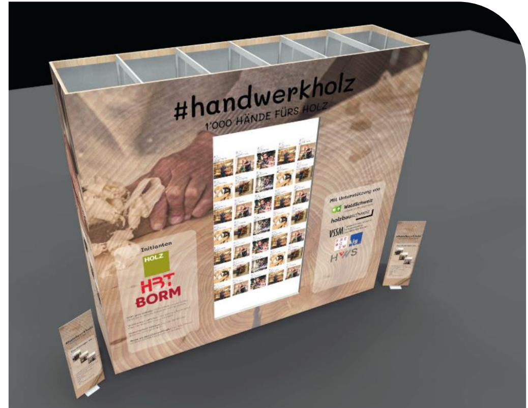
6*4 Meter Wand an der Holzmesse. Bild ist eine erste Visualisierung. Logos sind beispielhaft – nicht vollständig, Form und Inhalte noch nicht final